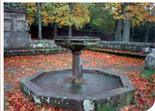
JARDÍN "EL BOSQUE", BÉJAR

El jardín de El Bosque, a las afueras de Béjar, es una de las pocas villas de recreo a la italiana que pueden disfrutarse en España. Sus orígenes están en un coto de caza perteneciente a los duques de Béjar. En el siglo XVI comienza a tomar la forma de un jardín con diversos rincones para el esparcimiento, siguiendo la moda italiana. No muy lejos de éste se encuentra el jardín de El Coto de Nuestra Señora del Carmen, en la localidad de Peñacaballera, trazado a finales del siglo XIX según los gustos románticos del momento. Destaca por la variedad botánica y la abundancia de especies exóticas.