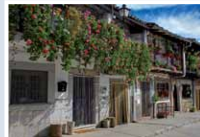
ARQUITECTURA POPULAR, LA CALZADA DE BÉJAR

distancias. Pero también es posible observar el viejo enlosado en muchos de los tramos, el alcantarillado de las cunetas o puentes de diversos tamaños. El mayor de ellos salva el Tormes en el acceso a Salamanca, que creció como ciudad gracias al paso de este importante camino.