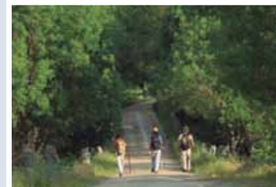
CAMINANTES EN EL PUENTE DE LA MALENA

El esfuerzo constructivo y la habilidad de los romanos en el trazado de las vías de comunicación queda aún bien patente a lo largo de la Vía de la Plata a su paso por la provincia. Uno de los rastros más evidentes es el reguero de millarios que permanecen orillados en muchos puntos de la Vía. Estos grandes bloques cilíndricos de granito servían para marcar las