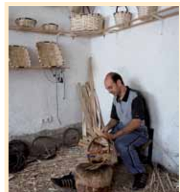
TALLER DE CESTERÍA DEL CASTAÑO

Los densos castañares que rodean esta localidad tienen mucho que ver con la ocupación más tradicional de sus habitantes. Si en el pasado la tonelería fue una de las principales industrias de Montemayor del Río, hoy lo es la elaboración de