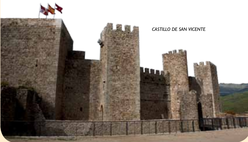
CASTILLO DE SAN VICENTE

En dirección al templo de La Asunción se localizan, entre las casas, restos de la muralla que defendía el castillo de San Vicente. Esta poderosa fortaleza, cuyas almenas brindan bellas panorámicas, es uno de los castillos más sobresalientes de la provincia. Su interior acoge un centro de interpretación sobre la vida en la Edad Media.