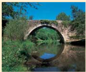
PUENTE DE PIEDRA