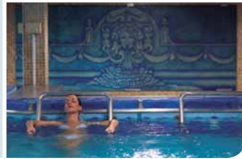
BALNEARIO DE LEDESMA

Sea cual fuere la dolencia del paciente o si, tan sólo, se pretenden unas jornadas de merecido reposo y solaz, cualquiera de estas opciones resulta una acertada elección.