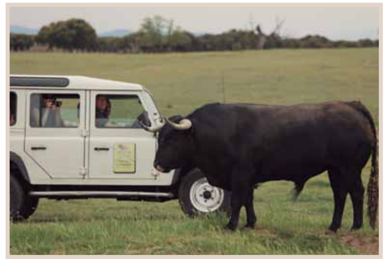
VISITA GUIADA A FINCA GANADERA

En función de la edad del ejemplar, su denominación varía de becerro a añojo, eral, utrero y novillo, antes de entregar su vida en la plaza.