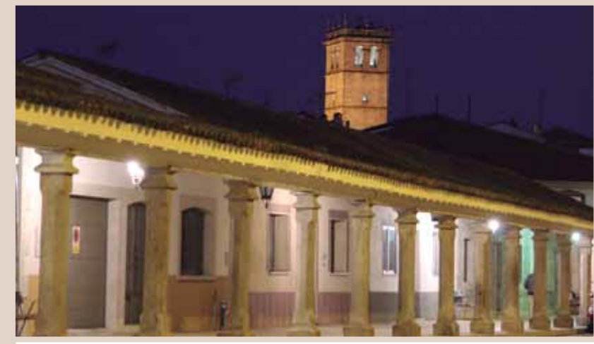
SOPORTALES Y TORRE DE LA IGLESIA, VITIGUDINO

Dicha denominación alude a las comarcas del corazón de Salamanca, que ocupan el centro de la provincia y que aportan la verdadera identidad de esta tierra y sus habitantes.