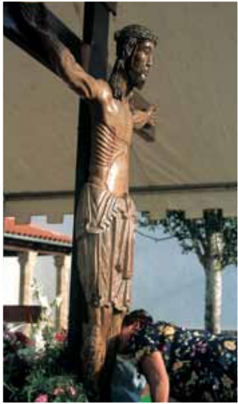
BESAPIÉS DEL CRISTO DE CABRERA, LASVEGUILLAS

La profunda religiosidad popular de estas tierras encuentra en las romerías una de sus más singulares manifestaciones. sencillas ermitas se tornan lugar de encuentro de los habitantes de la charrería, que se funden en un hondo fervor en torno a cristos y a vírgenes de humilde factura.