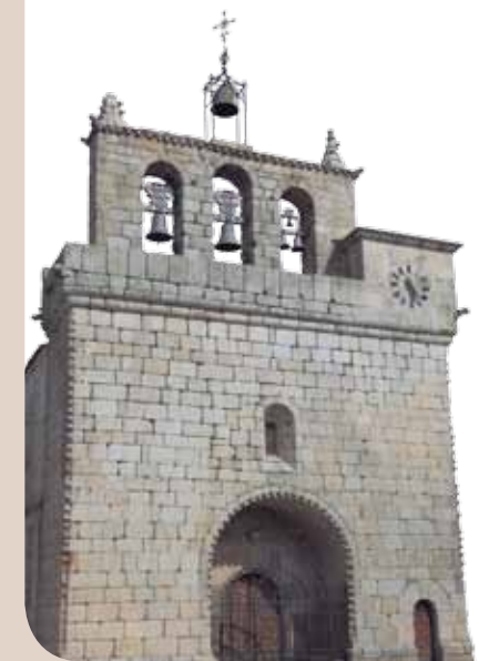
IGLESIA PARROQUIAL, VILLAVIEJA DE YELTES

Tierras de romerías y fiestas, ansias ocasiones de desempolvar de las arcas trajes, joyerías y filigranas, ornamentos todos del genuino porte charro.