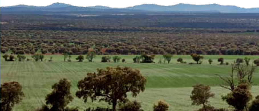
EL CAMPO CHARRO

La mano del hombre queda patente en las faenas camperas, ligadas al encinar y al propio toro de lidia, y en las señoriales casas y palacetes ganaderos.