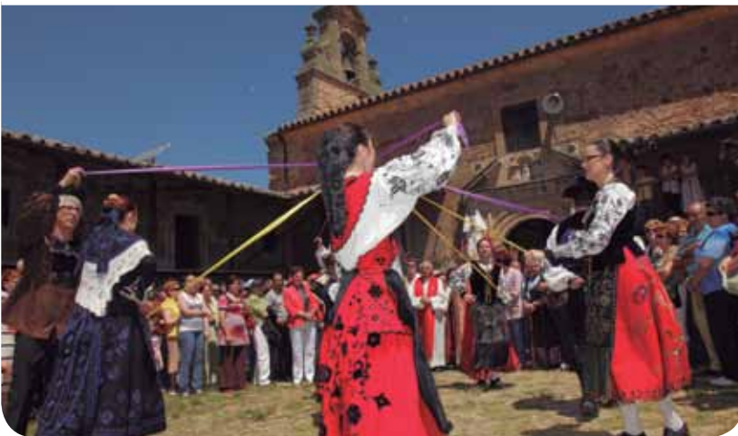
ROMERÍA DE LA VIRGEN DEL CUETO, MATILLA DE LOS CAÑOS DEL RÍO

Aún quedan otras celebraciones, como la de la Virgen de Los Remedios en Buena Madre, afamada por sus festejos taurinos, la Virgen del Castillo en Encina de San Silvestre, o el Cristo de la Laguna en Aldehuela de Yeltes. Fiestas y romerías que permiten al viajero conocer de primera mano el sentimiento y la personalidad de esta tierra.