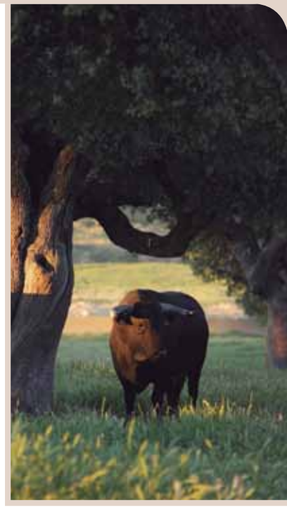
TORO BRAVO AL ATARDECER

Para gozar de su estampa hay que tomar cualquiera de las carreteras que, saliendo de la capital, se dirigen hacia localidades como Vecinos, Tamames, Las Veguillas, Vitigudino o a la misma Ciudad Rodrigo, lugar del afamado Carnaval del Toro.