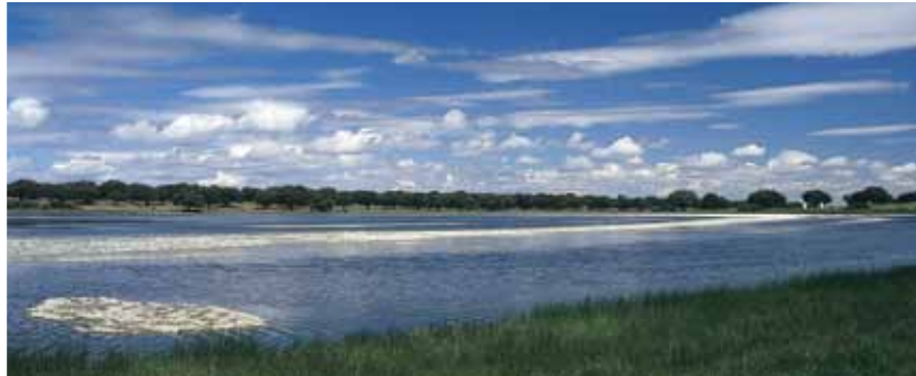
LAGUNA DEL CRISTO, ALDEHUELA DE YELTES

La mayoría se utilizan para abreviar los ganados, si bien a veces alcanzan notables dimensiones como la denominada Laguna del Cristo, cerca de Aldehuela de Yeltes. Otras dignas de mención son la de la Cervera, Campanero y Boada.