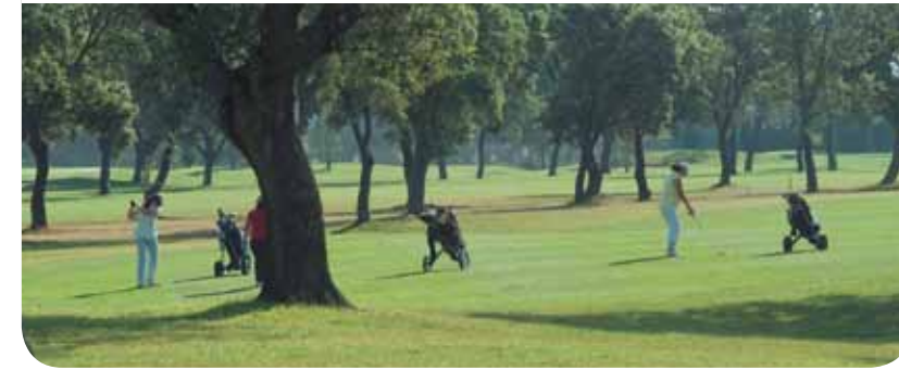
GOLF ENTRE ENCINARES

Magnífica ocasión para disfrutar de deporte y naturaleza en un escenario único que nos brinda el Campo Charro. Elija para esta experiencia entre los campos de Zarapicos, Villamayor o La Valmuza.